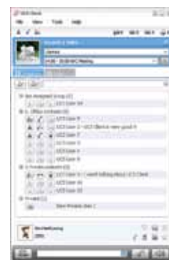
[ UCS клиент на персональном компьютере ]