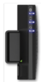
E-BMTU* (Bluetooth модуль)